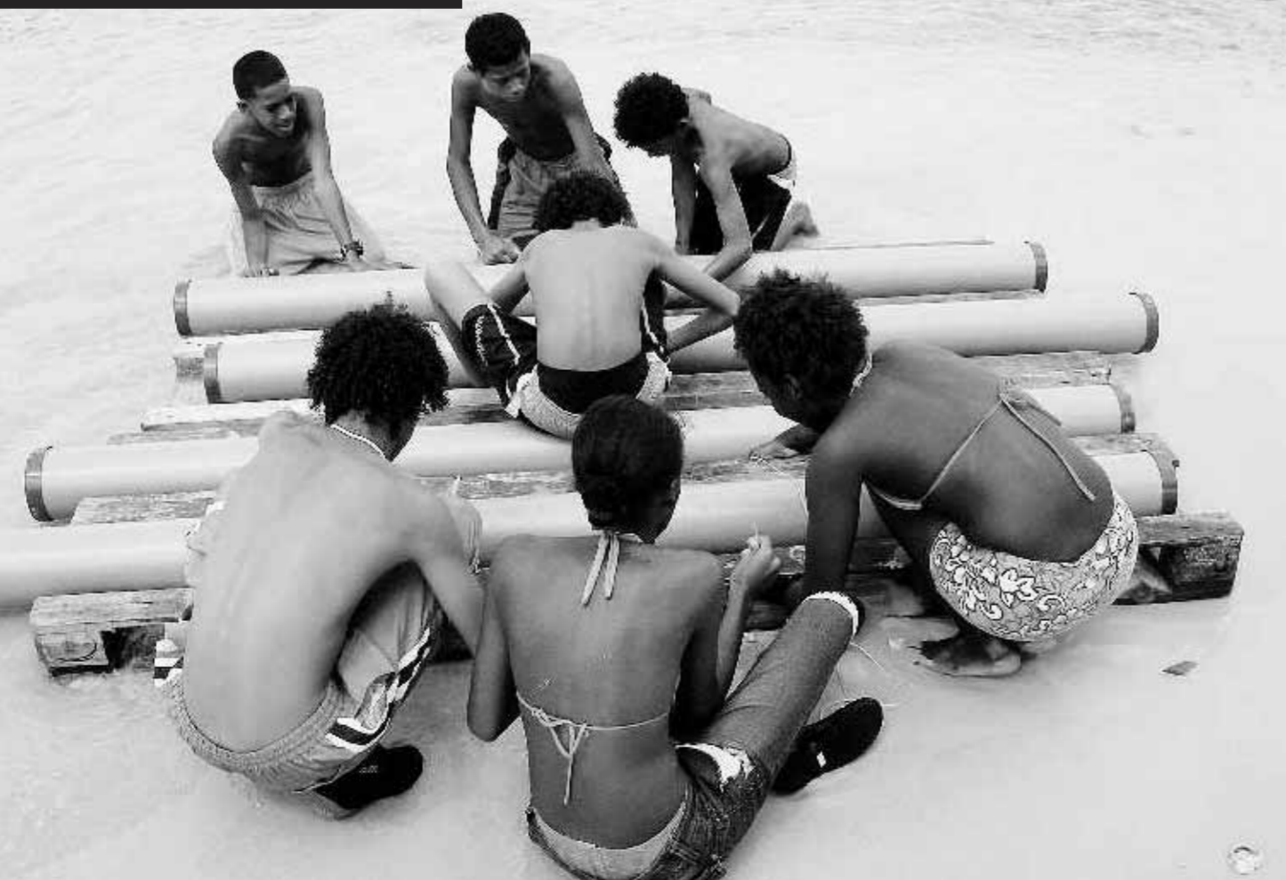
■ Op samenwerking wordt veel nadruk gelegd. De jongeren zitten niet continu met hun neus in de boeken, maar leren vooral in de praktijk, zoals samen een vlot maken.